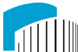
Logo: Theater Münster

Die »Entführung aus dem Serail« war schon zu Mozarts Lebzeiten seine mit Abstand erfolgreichste und meistgespielte Oper. Die »Entführung« gilt als erste große Tat des 26-jährigen Mozart, der sich wenige Monate zuvor sowohl aus der untergeordneten Stellung eines fürstlichen Angestellten als auch von der väterlichen Obhut befreit hatte, um als freier Komponist in Wien zu leben. In diesem Singspiel vereinen Mozart und sein Librettist die Typen der Volkskomödie: die adelige Geliebte, die freche Zofe, den komischen Diener und den edlen Geliebten.